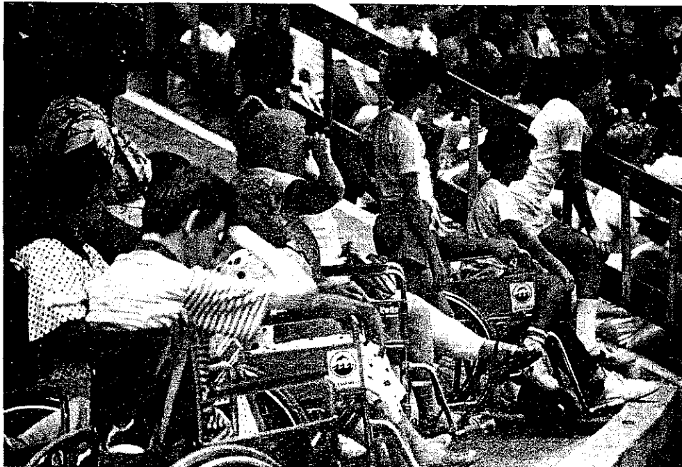
Sea World, Floride.

Plus concrètement, que le visiteur, quel qu'il soit, se sente bienvenu, qu'il puisse prendre les photos qu'il désire, s'asseoir, consulter livres et documents, se restaurer ou se désaltérer dans un cadre plaisant. Que les handicapés physiques ou les personnes âgées ne se sentent pas laissés pour compte. N'oubliez pas de prévoir à leur usage des ascenseurs de taille convenable, que ne remplacent pas les escaliers roulants. Que les gardiens soient aimables, les heures d'ouverture pratiques, que la garde et la distraction des enfants soient assurées.