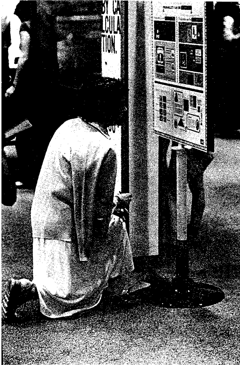
Photo Cousin California Museum of Science and Industry, Los Angeles